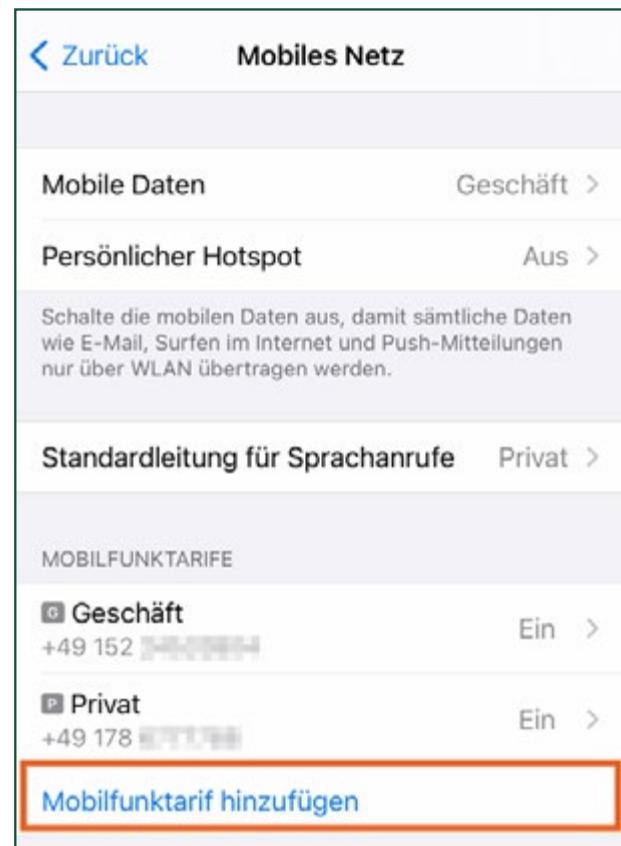
Abb.2: Fügen Sie einen Mobilfunktarif hinzu und scannen Sie danach den QR-Code Ihres Providers

Tippen Sie dann auf „Mobilfunktarif hinzufügen“. Scannen Sie danach den QR-Code, den Ihnen Ihr Mobilfunkanbieter zur Verfügung gestellt hat.