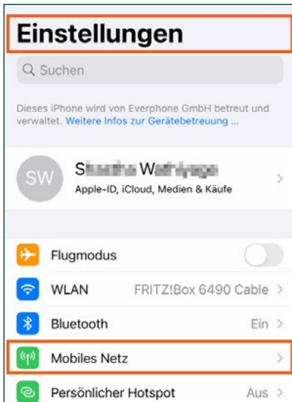
Abb.1: Gehen Sie in iOS unter „Einstellungen“ zu „Mobiles Netz“

Um Ihre eSIM mittels QR-Code einzurichten, rufen Sie bei Ihrem iOS-Gerät das Menü „Einstellungen -> Mobiles Netz“ auf.